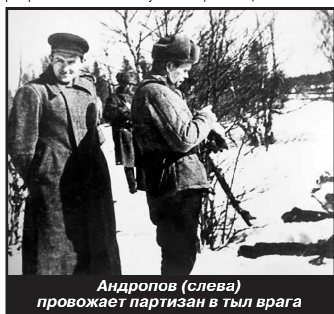
Андропов (слева) провожает партизан в тыл врага

кручиваться, самостоятельно делать карьеру, учась произносить правильные лозунги. Ювелиром он, впрочем, стал, но только по прозвищу, которое ему дали чекисты, кое-что слышавшие о сомнительном происхождении своего шефа. А вообще всю свою карьеру по комсомольской и партийной линии Юрий Владимирович делал слишком уж правильно, но без огонька, искреннего порыва и задора. Например, во время Великой Отечественной, руководя комсомолом Карело-Финской ССР и лично отправляя молодых партизан в тыл противника, никогда не выражал желания к ним присоединиться. Напротив, всячески отказывался от таких предложений, ссылаясь на больные почки и семейные сложности (с первой супругой он как раз развёлся и завёл новую семью).