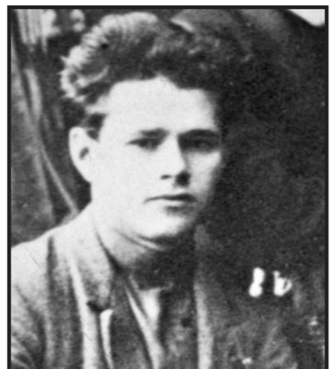
Юрий Андропов. Конец 1930-х годов

В общем, Андропова не только оправдали, но и повысили. Однако впечатления у него должны были остаться неоднозначные. Без революции, скорее всего, он унаследовал бы дедушкин бизнес, став состоятельным ювелиром. А вместо этого приходилось юлить, вытираться с помощью отца, тепло отзывался сам Сталин.