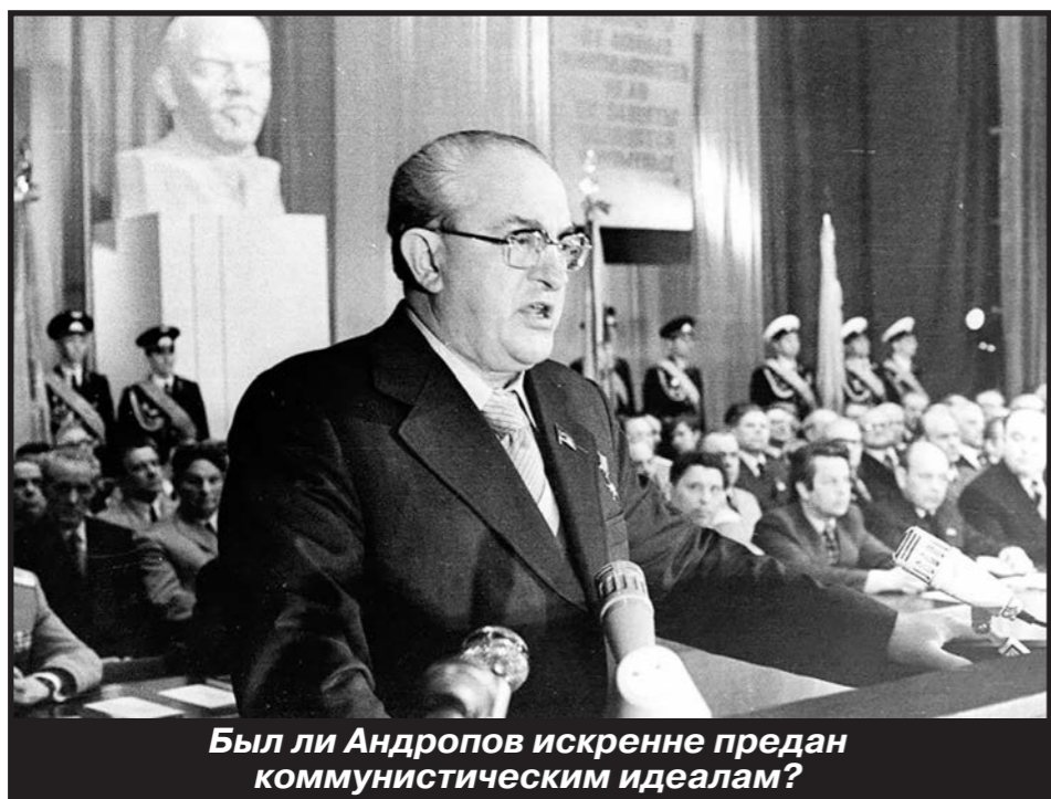
Был ли Андропов искренне предан коммунистическим идеалам?

Возглавив в 1967 году Комитет государственной безопасности, Юрий Андропов начал с того, что провёл через ЦК решение о создании в структуре своего ведомства нового подразделения — так называемого Пятого управления по борьбе с идеологическими диверсиями. С учётом последующих событий, закончившихся развалом СССР, можно констатировать, что с идеологическими диверсиями боролись неважно.